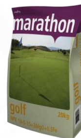
Marathon Golf 7-13-9

Melspring International B.V. Arnhemsestraatweg 8 6881 NG Velp