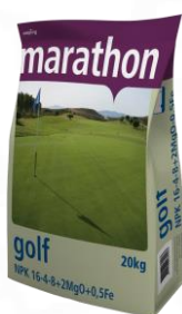
Marathon Golf 16-4-8