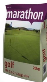
Marathon Golf 5-0-27