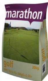
Marathon Golf 10-0-15